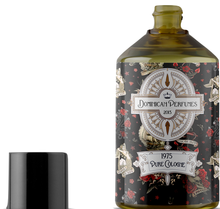
Travel Cologne 1975 x Dominican Perfumes @dominicanperfumes