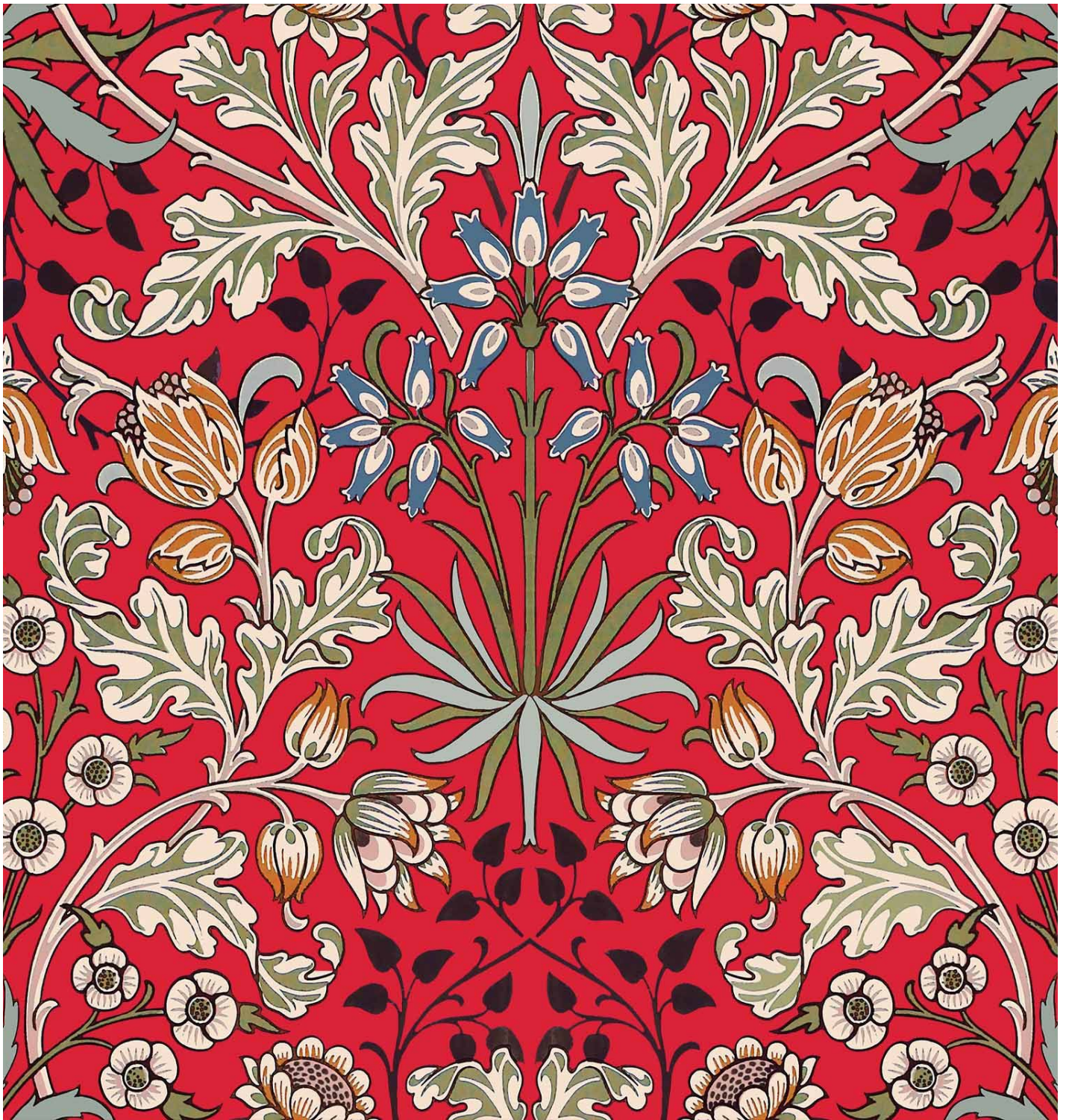
WILLIAM MORRIS (1834-1896)