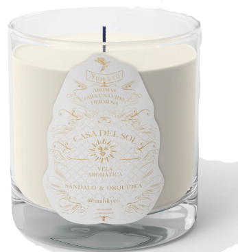
Velas aromáticas x Casa del Sol @casadelsohomecare